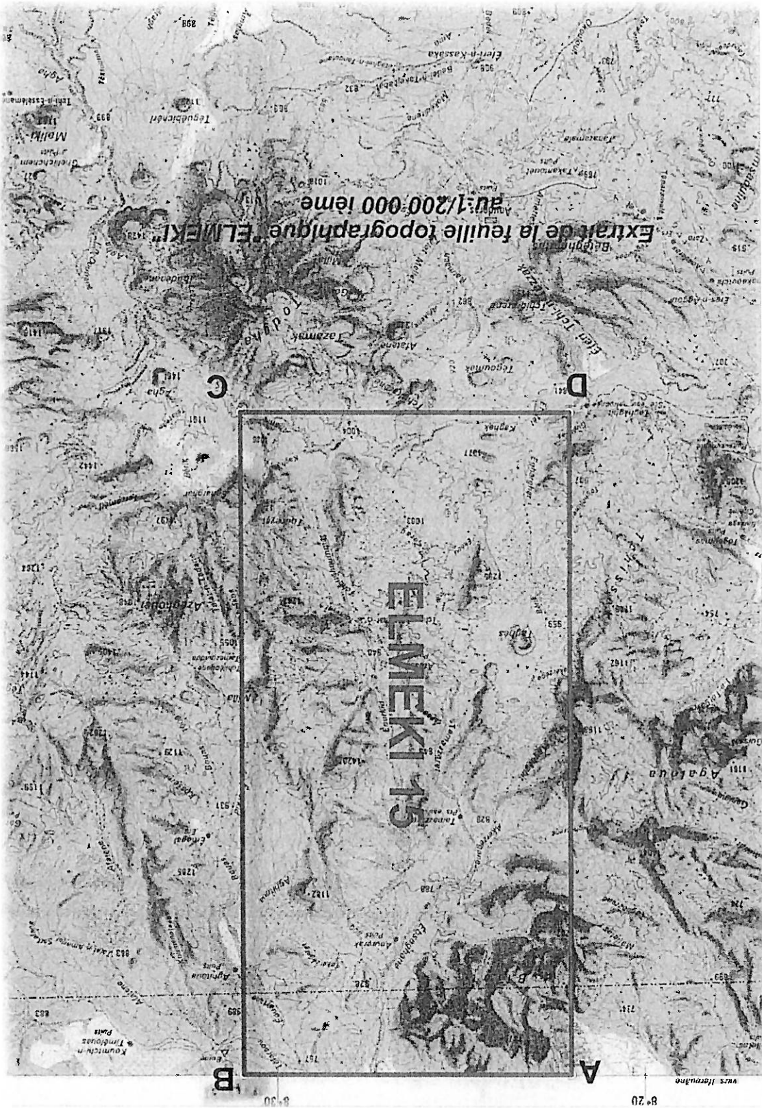
ANNEXE V CARTE GEOGRAPHIQUE