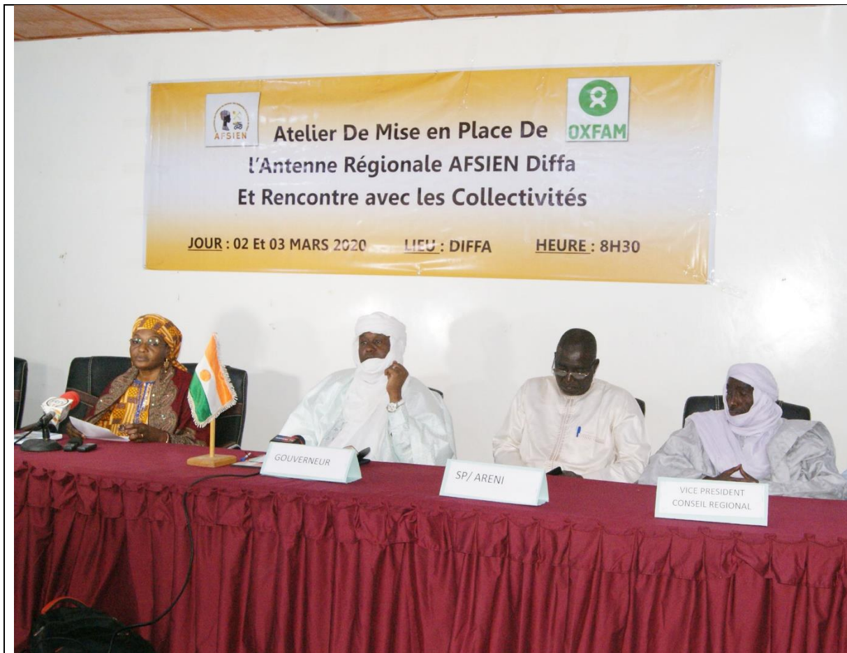
Du 2 au 3 mars 2020 AFSIEN a utilisé le rapport 2019 pour une campagne de dissémination